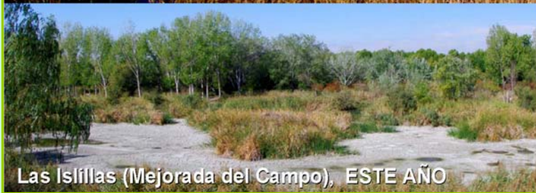
Las Islillas (Mejorada del Campo), ESTE AÑO