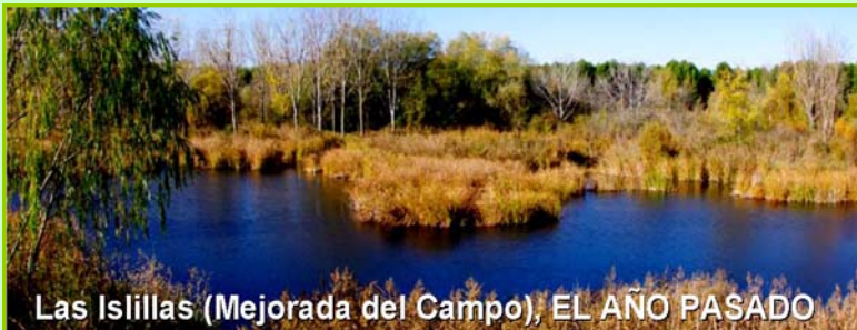
Las Islillas (Mejorada del Campo), EL AÑO PASADO

Este humedal está catalogado como de interés especial por la Comunidad de Madrid y forma parte del Parque Regional del Sureste , pero no parece que eso importe demasiado dada la situación que padece actualmente.